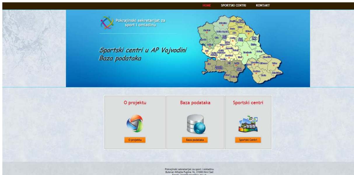
Слика 1. Насловна страна веб портала